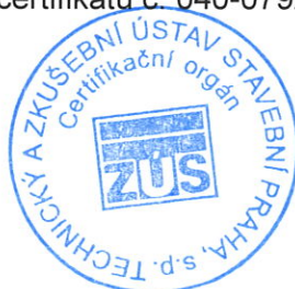
Razítko certifikačního orgánu

Tato příloha je nedílnou součástí certifikátu č. 040-079251.